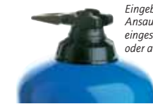
Eingebauter By-Pass: Ansaugsystem eingeschaltet (on) oder ausgeschaltet (off).

Die Optionen ermöglichen es, den Dosatron optimal an den Bedarf anzupassen. Deren Notwendigkeit wird mit der Unterstützung unserer technischen Abteilung festgelegt.