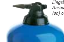
Eingebauter By-Pass: Ansaugsystem eingeschaltet (on) oder ausgeschaltet (off).

Die Optionen ermöglichen es, den Dosatron optimal an den Bedarf anzupassen. Deren Notwendigkeit wird mit der Unterstützung unserer technischen Abteilung festgelegt.