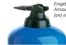
Eingebauter By-Pass: Ansaugsystem eingeschaltet (on) oder ausgeschaltet (off).

Die Optionen ermöglichen es, den Dosatron optimal an den Bedarf anzupassen. Deren Notwendigkeit wird mit der Unterstützung unserer technischen Abteilung festgelegt.